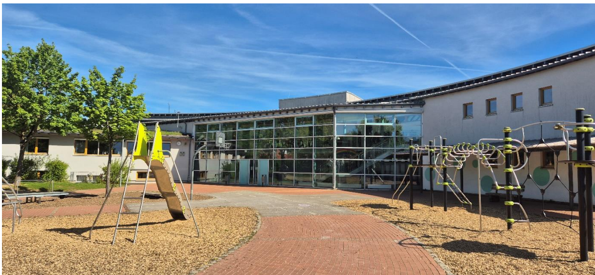
Blick vom Schulhof auf unsere Schule

Zu unserem multiprofessionellen Team gehören Grundschullehrkräfte, Sonderpädagogen, eine sozialpädagogische Fachkraft für die Schuleingangsphase sowie eine Schulsozialarbeiterin. Darüber hinaus haben wir eine Sekretärin, einen Hausmeister sowie ein Team, welches für die Reinigung der Schule zuständig ist. Die Betreuung übernimmt ein Team unter Leitung des Fördervereines. Einzelne Kinder werden von Schulbegleitungen unterstützt.